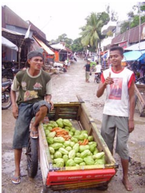
Palmira Permata Bachtiar/SMERU