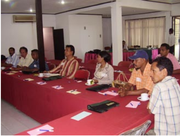
Palmira Permata Bachtiar/SMERU