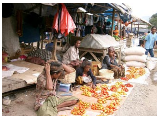
Palmira Permata Bachtiar/SMERU