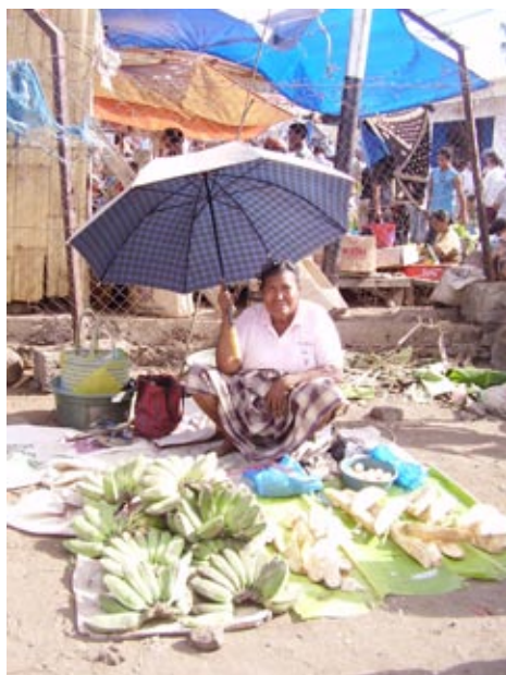
Palmira Permata Bachtiar/SMERU