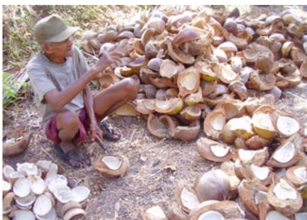
Palmira Permata Bachtiar/SMERU