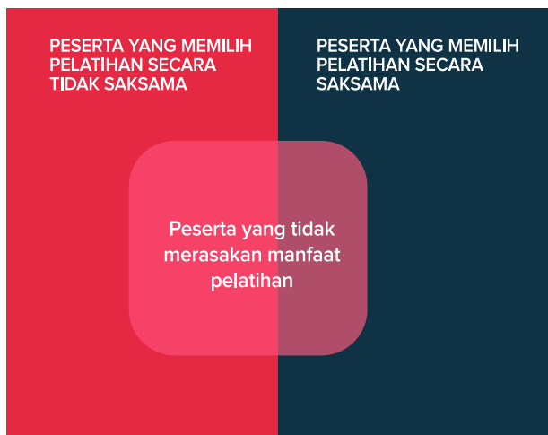
Gambar 3. Pemetaan peserta yang tidak merasakan manfaat dan cara peserta memilih pelatihan

Gambar 3 menunjukkan adanya irisan yang besar antara proses pemilihan pelatihan dan manfaat pelatihan yang dirasakan. Hampir semua peserta yang tidak merasakan manfaat pelatihan ternyata tidak melakukan proses pemilihan secara saksama.