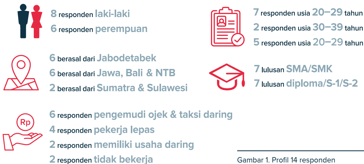
Gambar 1. Profil 14 responden

Penelitian kualitatif ini bertujuan mengidentifikasi isu-isu penting dari sisi peserta program KP untuk perbaikan pelaksanaan program KP selanjutnya. Studi ini dilakukan dalam periode Mei–Juni 2020 dengan menggunakan metode wawancara mendalam. Sampel sebanyak 14 orang dengan tingkat pendidikan, jenis kelamin, usia, pekerjaan, dan tempat tinggal yang berbeda dipilih dengan teknik snowball (bola salju) (Gambar 1). Sebagaimana penelitian kualitatif yang berfokus pada kedalaman informasi, tujuan studi ini adalah untuk menjawab pertanyaan mengapa dan bagaimana.