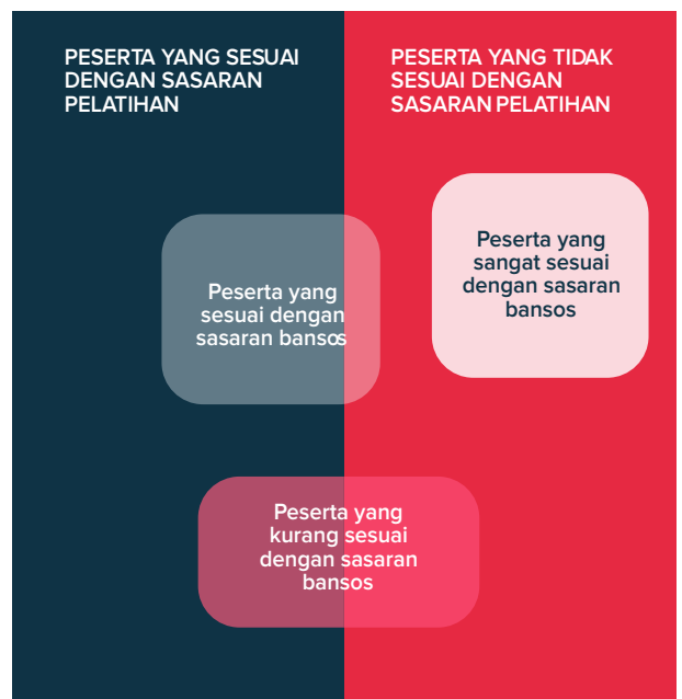
Gambar 2. Pemetaan ketepatan sasaran pelatihan dan bansos

Peserta yang termasuk dalam kelompok ini pada umumnya memilih pelatihan berdasarkan rencana kariernya untuk meningkatkan kompetensi dan produktivitas di bidang pekerjaan saat ini. Misalnya,