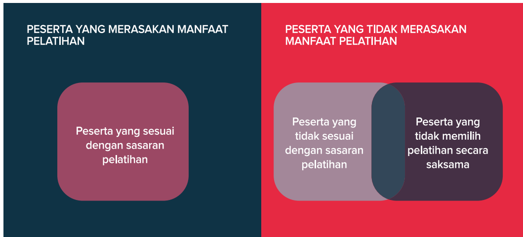
Gambar 5. Irisan antara ketepatan sasaran pelatihan, proses pemilihan pelatihan, dan persepsi tentang manfaat pelatihan