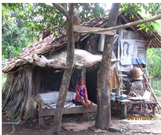
Hastuti-SMERU Ruta miskin nonpenerima BLSM

Hasil FGD yang sangat penting diperhatikan adalah bahwa ruta dari kelompok miskin tapi tidak menerima BLSM jumlahnya sangat besar, berkisar antara 26%–81%. Bahkan dari diskusi lebih lanjut terungkap bahwa dalam kelompok miskin tersebut terdapat ruta sangat miskin yang tidak menjadi penerima BLSM. Di Karawang dua dari empat ruta sangat miskin sedangkan di Bandung enam dari delapan ruta sangat miskin tidak menjadi penerima BLSM.