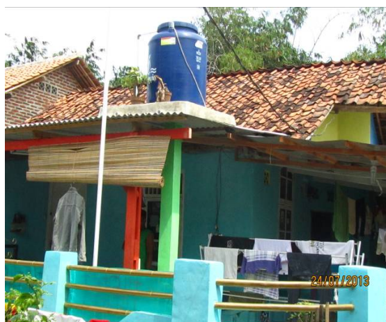
Hastuti-SMERU Ruta mampu penerima BLSM