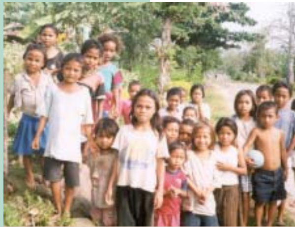
Tingkat kesadaran sebagian masyarakat masih rendah tentang pentingnya pendidikan sebagai bekal di masa depan. In some communities, there is a low level of community awareness of the importance of education as the key to the future.

Kelima, faktor budaya. Misalnya kebiasaan tradisional penduduk suku Madura di Pontianak untuk mengawinkan anak perempuannya setelah tamat sekolah dasar, atau pandangan masyarakat Cina bahwa bila anaknya tidak pandai bersekolah, maka lebih baik bekerja membantu orang tuanya.