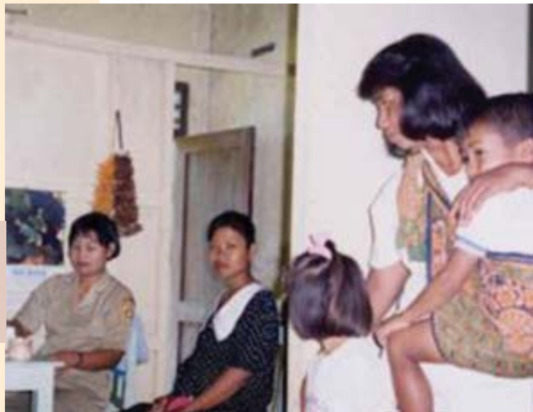
Dok. SMERU/SMERU Doc.

The low utilization of the health cards by the poor indicates that there is inequality in obtaining health services.