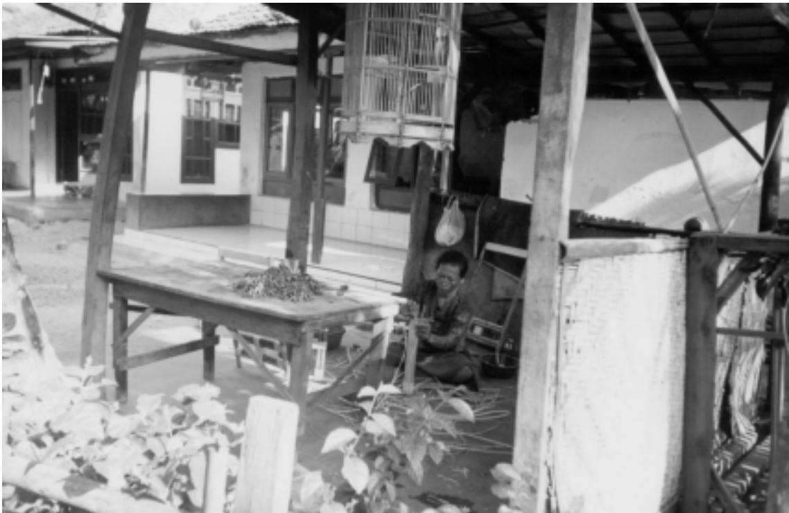
Plating rattan can be done anywhere and at anytime Menganyam rotan dapat dilakukan dimana dan kapan saja.