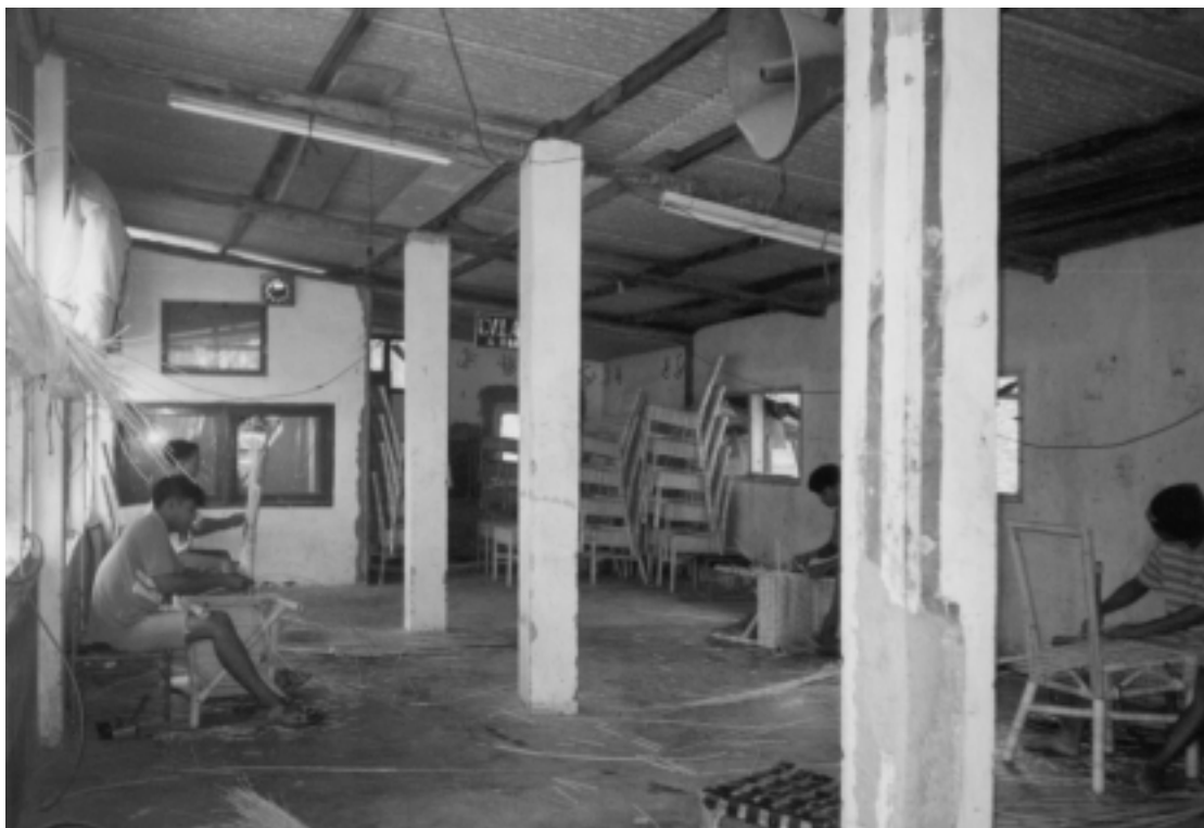
One of the rattan sub-contractors in Desa Buyut Salah satu sub-kontraktor rotan di Desa Buyut