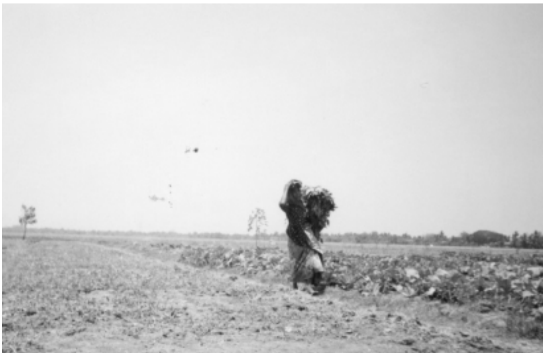
Young villagers are beginning to abandon farming activities Kaum muda mulai meninggalkan kegiatan usaha tani