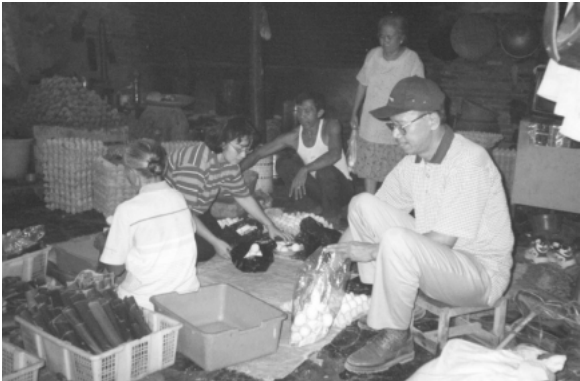
Among others, selling rice cakes and salted eggs have contributed to improvements in the economic conditions of some villagers Berjualan lontong dan telur asin antara lain telah turut membantu meningkatkan kondisi ekonomi warga desa