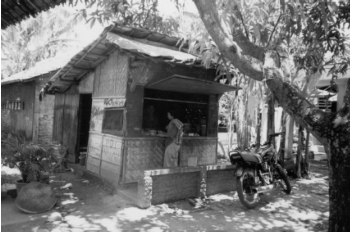
Improved economic conditions have helped to increase the community's buying power Ekonomi penduduk yang membaik meningkatkan daya beli masyarakat