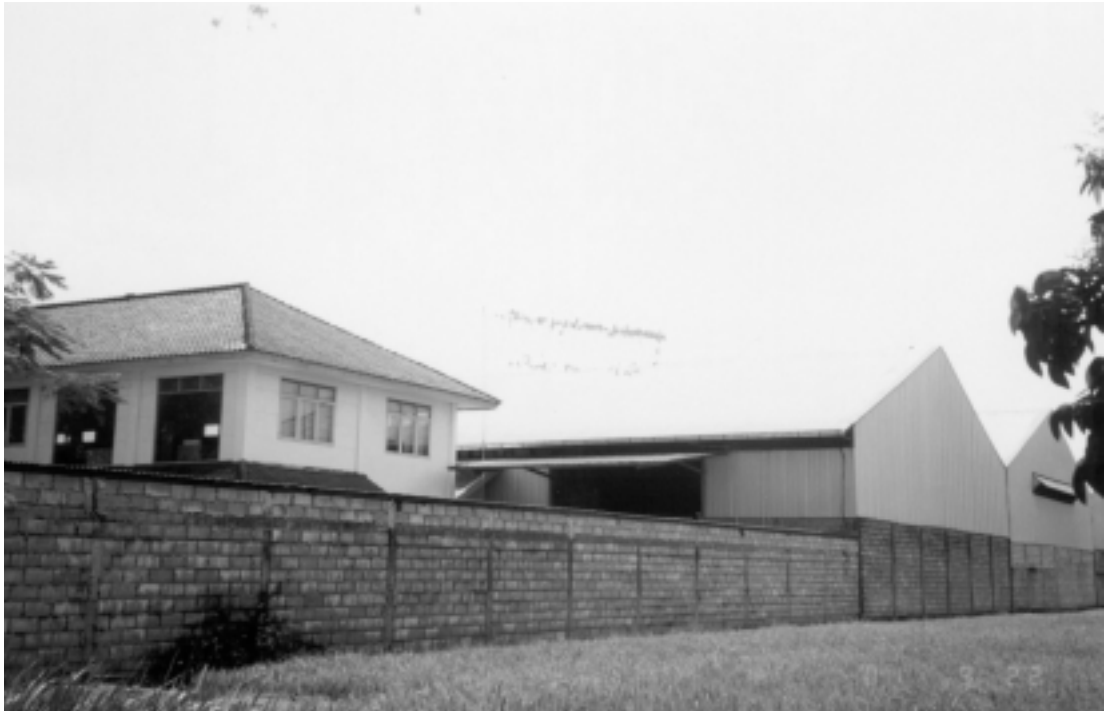
One of the large rattan companies in the neighboring kecamatan Salah satu pabrik besar industri rotan di kecamatan tetangga