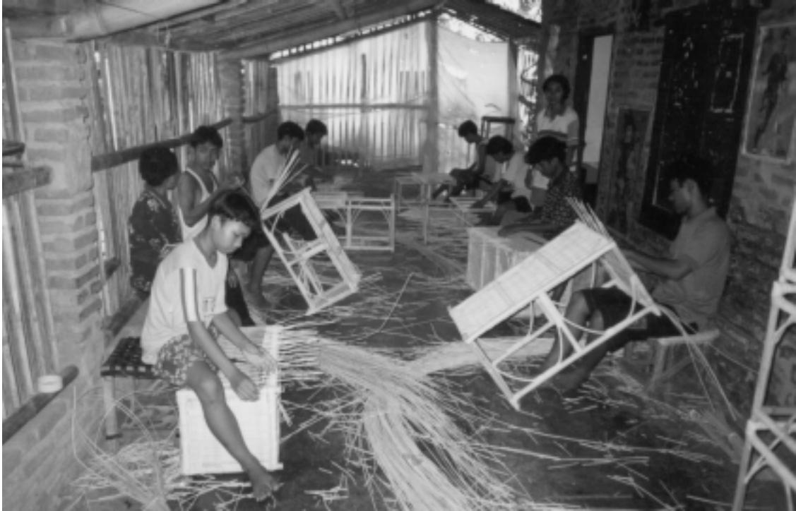
Piece-workers can earn additional income by working at home for rattan sub-contractors Pekerja borongan dapat memperoleh penghasilan tambahan dengan bekerja di rumah untuk subkontraktor pabrik rotan