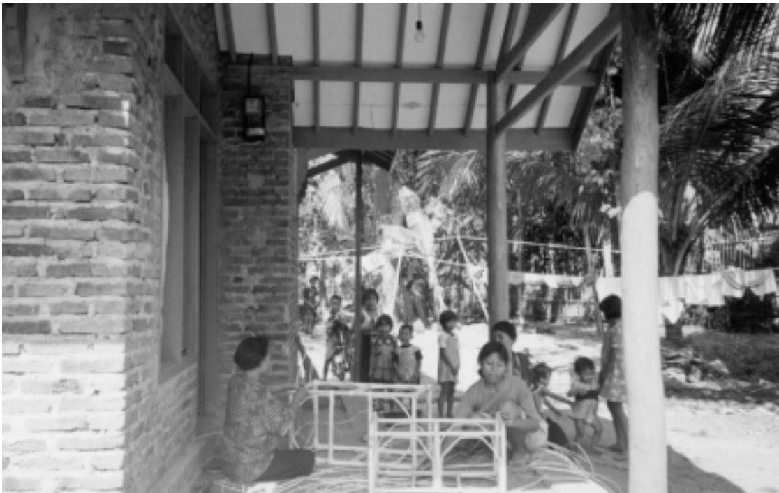
Young and old, male and female, educated and non-educated villagers from Desa Buyut have escaped poverty by working in rattan industries Penduduk Desa Buyut: tua-muda, laki-laki-perempuan, sekolah atau tidak sekolah terangkat dari kemiskinan