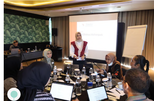
Article 33 Indonesia | 24 Juni 2025 | FGD Seri 3: Lingkungan Belajar yang Aman, Nyaman, dan Toleran