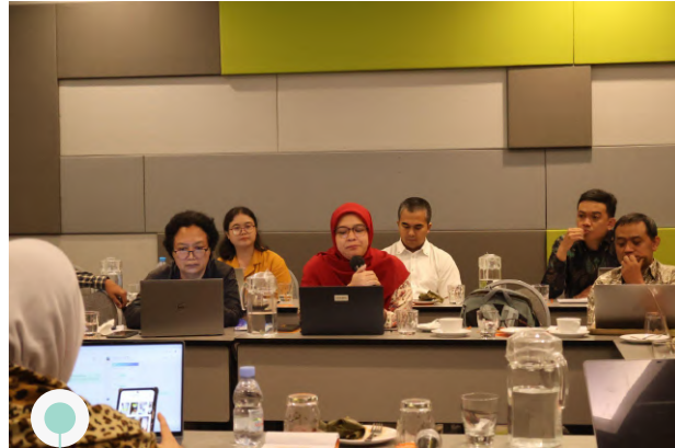
Article 33 Indonesia | 22 April 2025 | FGD Seri 1: Wajib Belajar