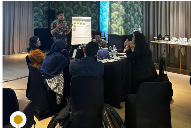
Article 33 Indonesia | 10 September 2025 | FGD Seri 4: Pembiayaan Pendidikan