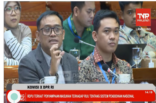
Article 33 Indonesia | 22 September 2025 | Rapat Dengar Pendapat Umum (RDPU) Komisi X DPR RI