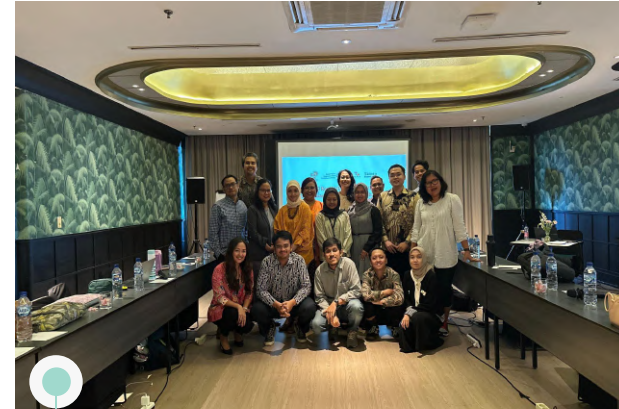
Article 33 Indonesia | 16 Oktober 2025 | FGD Seri 5: Kemampuan Fondasi dan Pengasuhan Anak