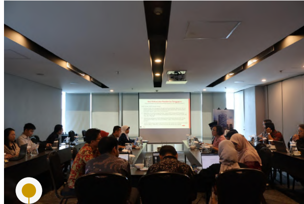
Article 33 Indonesia | 4 Juni 2025 | FGD Seri 2: Tata Kelola Organisasi Satuan Pendidikan