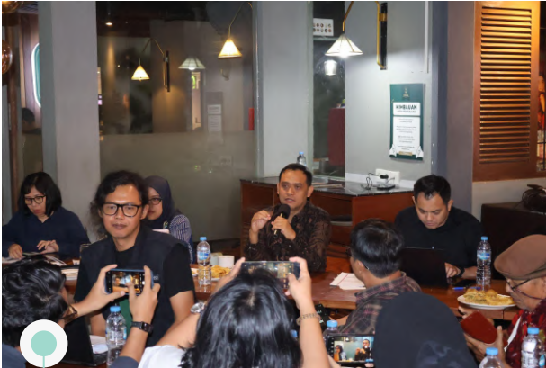
Article 33 Indonesia | 12 Agustus 2025 | Media Briefing Bersama Tim Wartawan terkait Tema FGD Seri 1-3