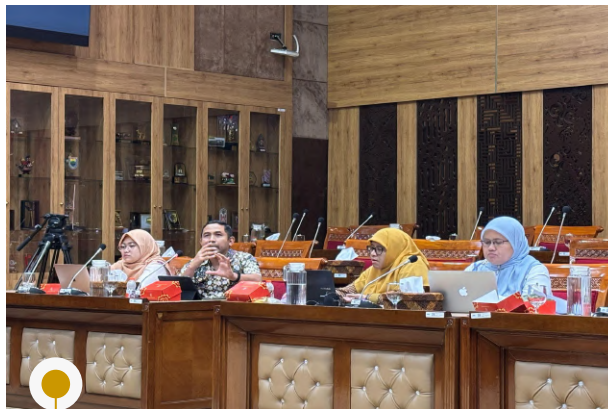
Article 33 Indonesia | 4 Juni 2025 | Paparan Hasil Diskusi RUU Sisdiknas Seri 1-3 kepada Komisi X DPR RI