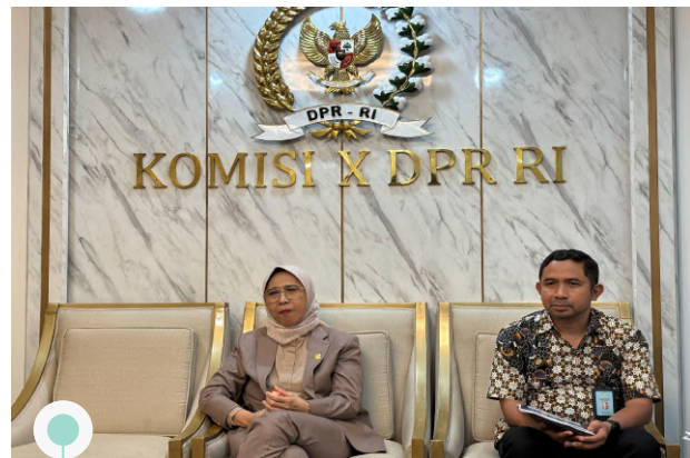
Article 33 Indonesia | 29 April 2025 | Paparan Hasil Diskusi RUU Sisdiknas Seri 1 kepada Komisi X DPR RI